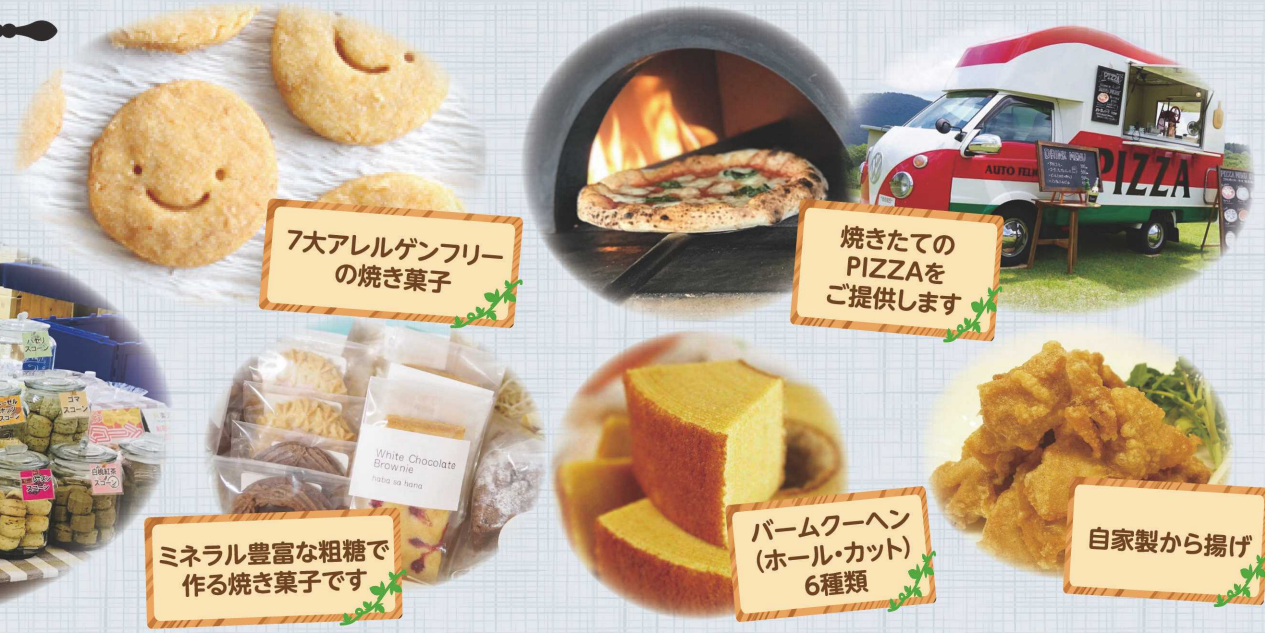
7大アレルギーフリーの焼き菓子