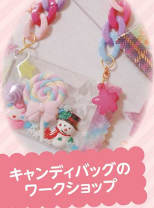
スタンドグラス風アートの販売とws