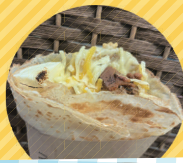
グルテンフリークレープ