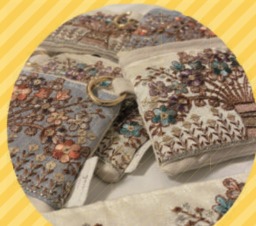
インド刺繍リボン小物