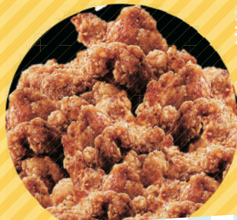
秘伝だれの唐揚げ丼