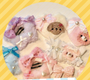
ハンドメイド アクセサリー