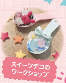
スイーツデコの ワークショップ