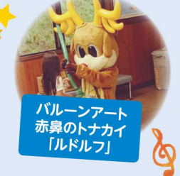
バルーンアート 赤鼻のトナカイ 「ルドルフ」