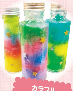
カラフル 宇宙ボトル ワークショップ