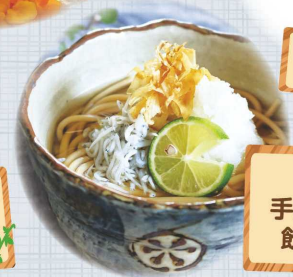
淡路島 手延べめん 飲食販売