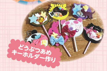
どうぶつあめ キーホルダー作り