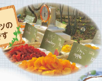
美味しい ドライフルーツの 量り売りです