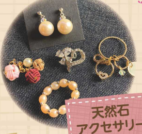
天然石 アクセサリー