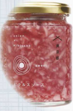
玉葱 ピクルスソース