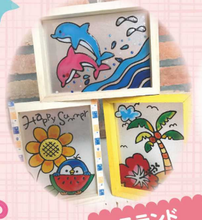
スタンド グラス風 アート体験