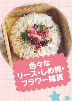
色々な リース・しめ縄・ フラワー雑貨