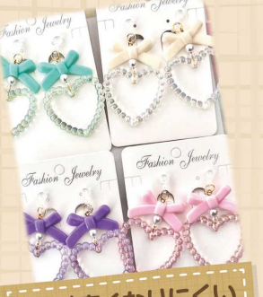
耳が痛くなりにくい キッズイヤリング