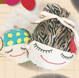
オリジナル キャラクター (レディちゃん)雑貨