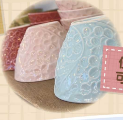
使いやすく 可愛い食器