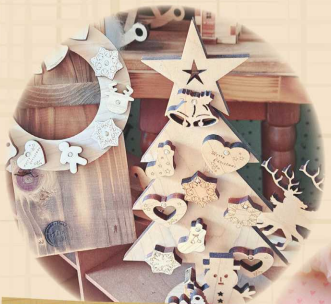
ヒノキの クリスマス飾り