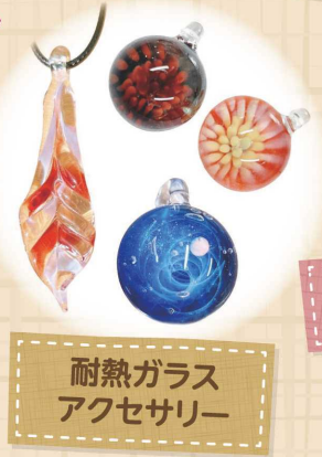
耐熱ガラス アクセサリー