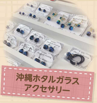
沖縄ホタルガラス アクセサリー