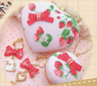
ほんのり甘めの アクセサリー&雑貨