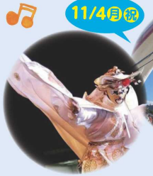
変面師やまち& スマイルサーカス