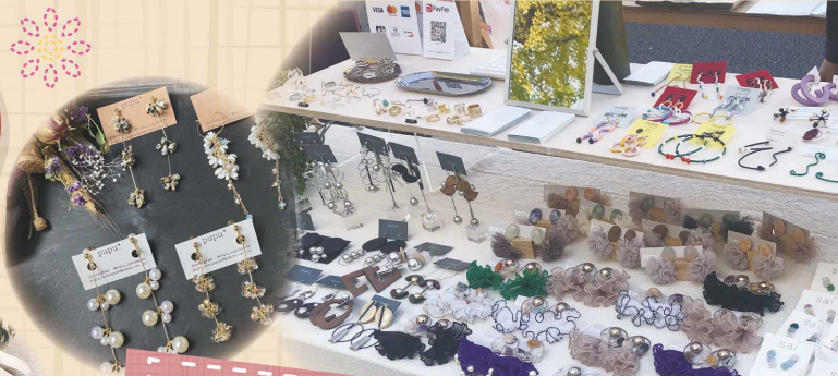
ハンドメイドアクセサリー