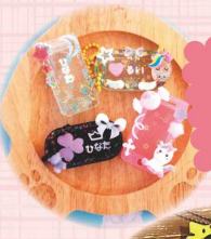
お名前入りの オリジナル キーホルダー 作り体験