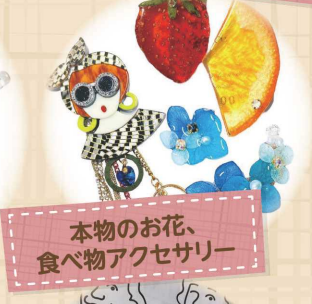
本物のお花、 食べ物アクセサリー