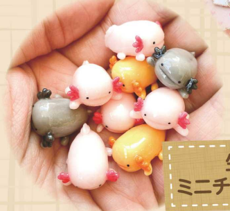
生き物の ミニチュアフィギュア