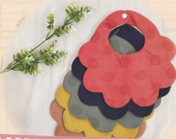
ベビースタイ、 こんなの欲しかった布小物