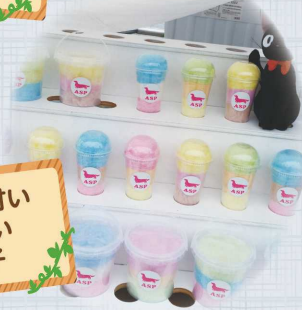
ふわっと甘い 美味しい 綿菓子