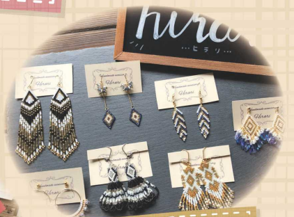
ビーズアクセサリ、 キッズアクセサリ