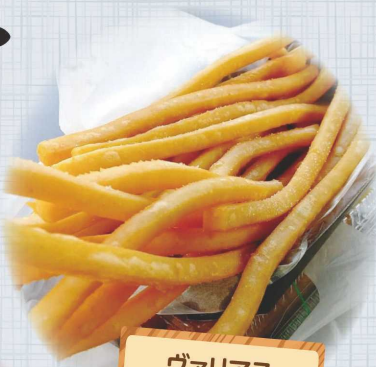
ヴァリアス スーパーロング ポテト