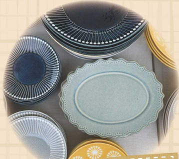
可愛い美濃焼食器を 産地からお届け