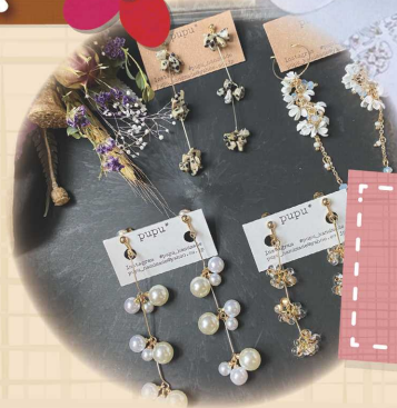
ハンドメイド アクセサリ