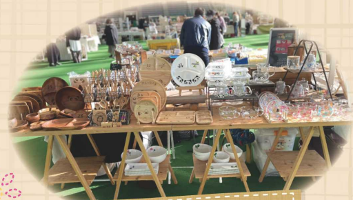
手書き食器&木製食器