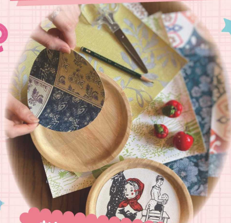
おしゃれな壁紙で作る オリジナルトレイ