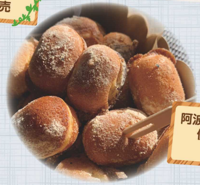
阿波和三盆を使った 優しい甘さの カステラ