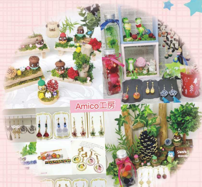
Amico工房 どんぐり細工・WS