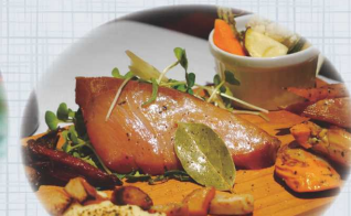
日和佐燻製工房 魚介とチーズ、 半熟玉子のスモーク