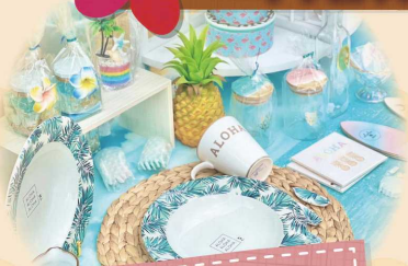
ハワイアンな ハンドメイド食器&雑貨