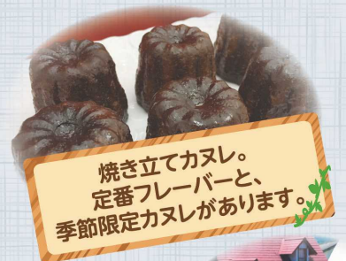
焼き立てカヌレ。 定番フレーバーと、 季節限定カヌレがあります。