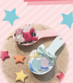
スイーツデコの ワークショップ