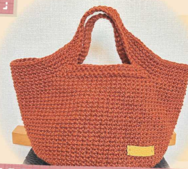
手編み ジュートバッグ