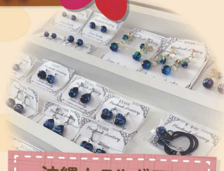
沖縄ホテルガラス アクセサリー