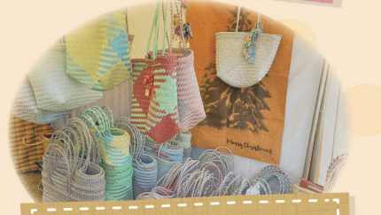
インドネシアで 手作りしているかごバッグ