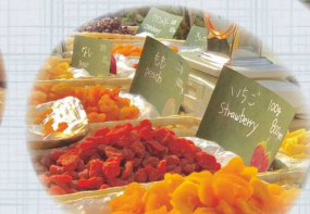
美味しい ドライフルーツの 量り売りです