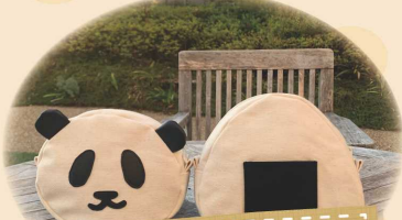
8号帆布で作った おにぎりとパンダバッグ!