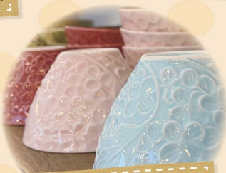
使いやすくて 可愛い食器♪