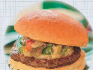
日本初! グアムで人気の 牛肉100%バーガー