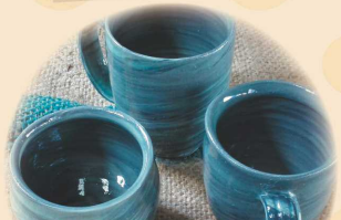
マーブルの コーヒーカップ