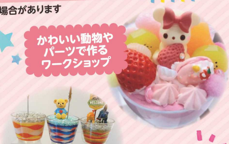
カラーサンド 体験