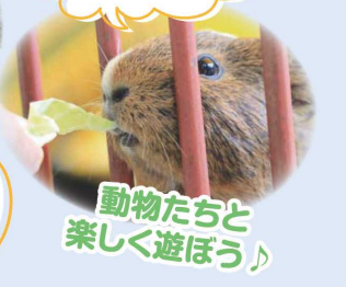
動物たちと 楽しく遊ぼう♪