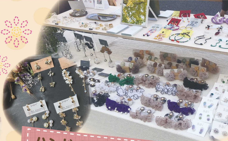
ハンドメイドアクセサリ