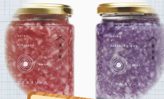
玉葱 ピクルスソース