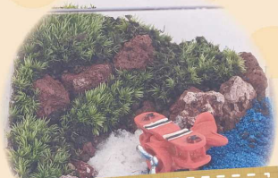
苔テラリウムの ワークショップと販売